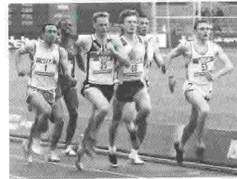
La vida cristiana se asemeja a una carrera de largo aliento.

Vivimos en medio de una cultura que le tiene fobia al aburrimiento, una cultura del mínimo esfuerzo, del hacer lo que me gusta y no lo que vale la pena aunque me cueste, del capricho, del tenerlo todo y de la incapacidad de la renuncia. Es una generación