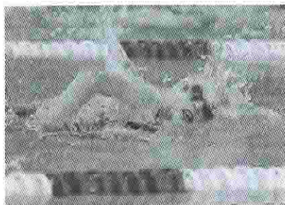
El despliegue físico ha de contribuir al fortalecimiento del espíritu y no convertirse en una idolatría del cuerpo.

En este contexto, la práctica deportiva es vista por algunos como un mero instrumento para mantener la buena forma física y lograr la apariencia perfecta. Existen ya casos de adicción a los ejercicios, llamada vigorexia. Así, hoy más que nunca se hace necesario anunciar que «el verdadero atleta no debe dejarse arrastrar por la obsesión de la perfección física, ni ha de dejarse subyugar por las duras leyes de la producción y del consumo, o por consideraciones puramente utilitaristas y hedonistas» 38 . Cuando las demostraciones de habilidad y de fuerza física desembocan en la idolatría del cuerpo, el deporte se convierte en fenómeno alienante 39 .