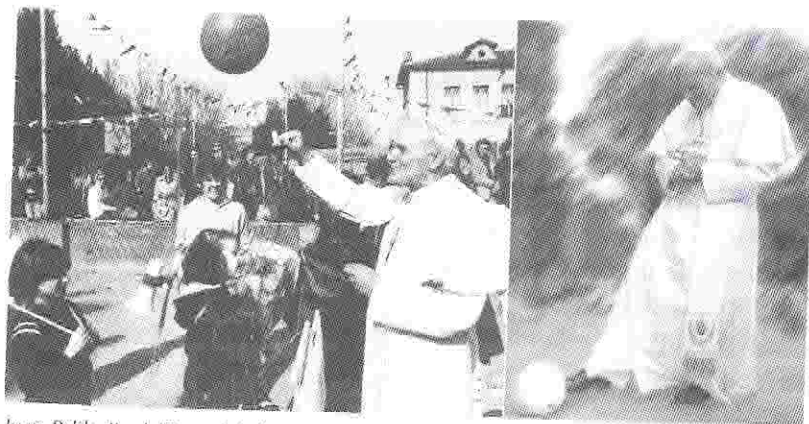
Juan Pablo II, el "Papa del deporte", mostró los altos ideales a los que debe conducir la práctica deportiva.

presionante resistencia al dolor durante la Pasión (ver Mt 26 y 27). Los estudios hechos a la imagen de la Sábana Santa de Turín no hacen sino corroborar la tesis de la fortaleza física del Señor Jesús.