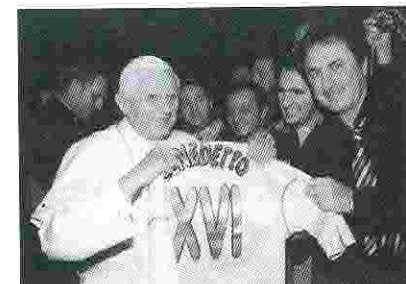
Es necesario seguir fortaleciendo la presencia de la Iglesia en el mundo del deporte.

dad. Sin embargo, la “pastoral deportiva” es aún floreciente, pues queda todavía mucho por hacer. Precisamente una de las finalidades de la sección “Iglesia y deporte” es promover una mayor atención pastoral al ambiente deportivo. Si bien no es la materia principal del presente texto profundizar en concreciones pastorales, cabe mencionar algunos elementos que puedan ayudar en esa línea.