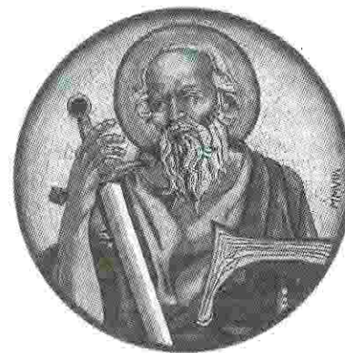
San Pablo compara el deporte con la vida cristiana y nos exhorta a esforzarnos para alcanzar la meta.

rrremos” por nuestra propia realización: el ciento por uno aquí en la tierra y la promesa de la comunión eterna de amor con Dios en el Cielo. En el deporte se “corre” por un premio terrenal, una corona que se marchita. San Pablo utiliza el ejemplo de los deportistas para cuestionar a los cristianos acerca de su nivel de exigencia personal en el seguimiento del Señor Jesús, ya que muchas veces éste no es tan alto como el