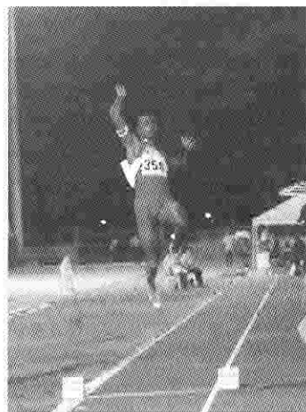
El deporte debe ser una escuela de educación en las virtudes.

En el documento de Puebla , los obispos latinoamericanos también hacen notar que si bien para algunos el deporte es medio de educación y sano entretenimiento, para otros lo es de alienación: «El joven ocupa gran parte del “tiempo libre” en el deporte y en la utilización de los medios de comunicación social. Para algunos, son instrumento de educación y sana recreación; para otros, elementos de alienación» 36 . Señalan asimismo que existe un uso abusivo del deporte en los medios de comunicación, lo que puede convertirlo en instrumento de evasión: «El sistema publicitario tal como se presenta y el uso abusivo del deporte en cuanto elemento de evasión, los hace factores de alienación; su impacto masivo y compulsivo puede llevar al aislamiento y hasta la desintegración de la comunidad familiar» 37 . Conocer y tener en cuenta algunos de estos peligros puede ayudar a la lucha por mantener siempre el verdadero sentido de la actividad deportiva.