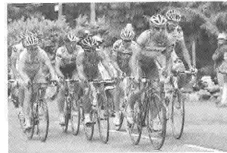
Los deportistas tienen hoy un importante rol social, especialmente como modelos para los jóvenes.

«El deporte, superando la diversidad de culturas e ideologías, es una ocasión idónea de diálogo y entendimiento entre los pueblos,